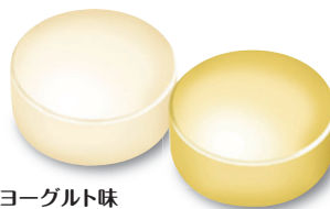
プレーンヨーグルト味